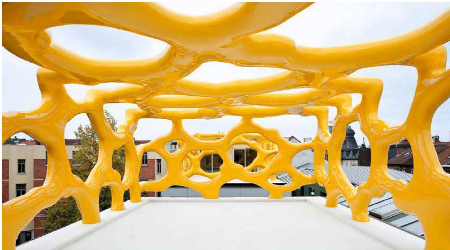
WARSUBEC 2009, fotograaf Tom De Visscher (Zebrastraat Gent, Foundation Liedts-Meessens)