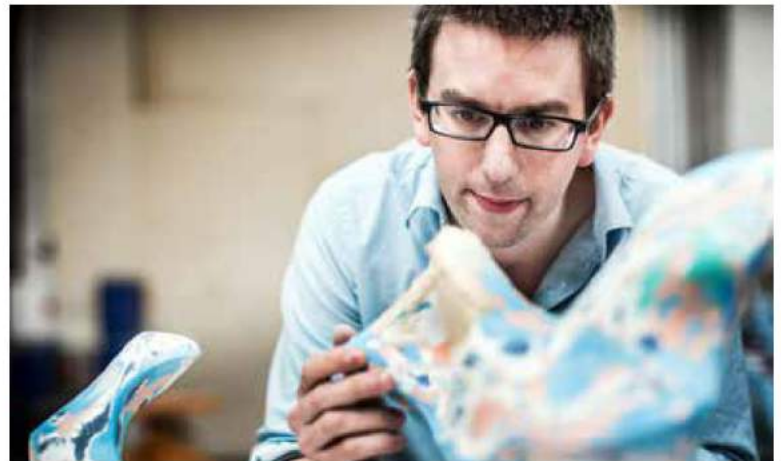
Nick Ervinck