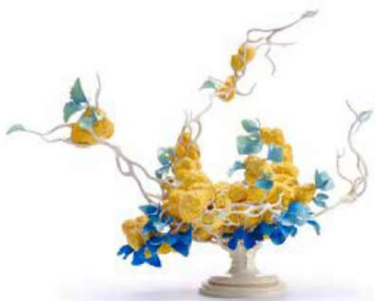
NABEKIARTS 2013-2014