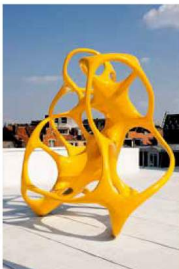
NIEBLOY 2009