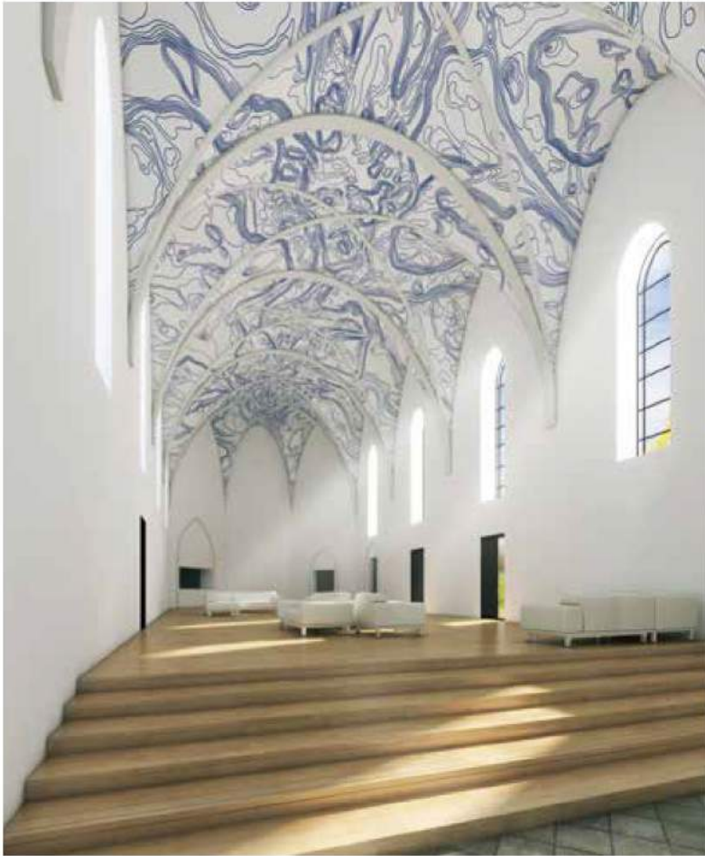
BOLBEMIT 2013–2014, (Clarenhof Hasselt, AZO architects)