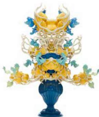
NABEKIESAV 2013-2014