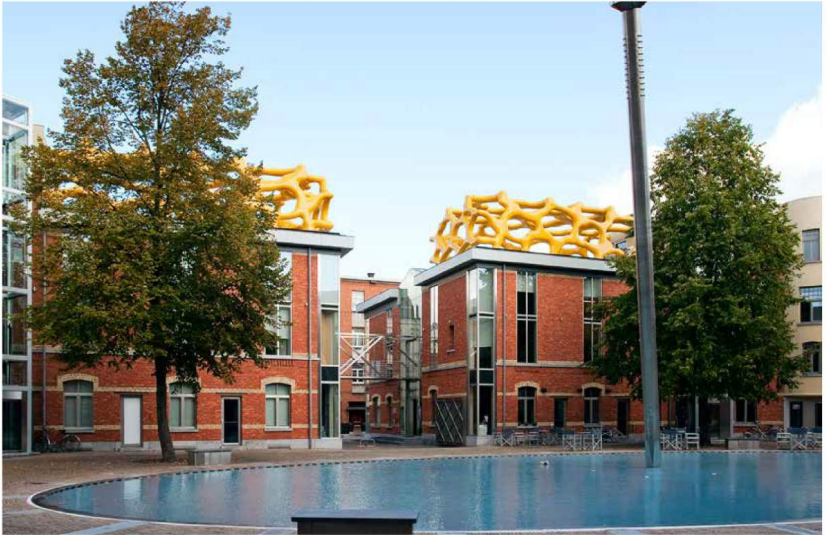
WARSUBEC 2009 (Zebrastraat, Gent, Foundation Liedts-Meessens)

In het voorjaar van 2016 lopen er maar liefst negen tentoonstellingen van het werk van Nick Ervinck. Zijn sculpturen zijn onder meer te zien in het Zuid-Franse Sète en bij Mercedes Benz in Berlijn, in de Warande in Turnhout en in Paleis Soestdijk in Baarn. Alleen al het opbouwen en afbreken van zoveel exposities vergt veel aandacht en spierkracht. De vijfendertigjarige beeldhouwer heeft de voorbije jaren veel moeten investeren in onder andere een spuitcabine en een magazijn in het West-Vlaamse Lichtervelde, en in het samenstellen en bijhouden van een vaste ploeg van een zestal medewerkers. “De manager en de kunstenaar in mij zijn geregeld met elkaar in conflict,” geeft hij toe. “Maar eigenlijk is de omvang van mijn bedrijf niet bijzonder. Rubens had wel twintig assistenten in dienst en sommige hedendaagse kunstenaars hebben een veelvoud daarvan. Ik heb mijn medewerkers vooral nodig voor de uitvoering van mijn ideeën. Andere beeldhouwers besteden dat aspect van hun werk uit aan bedrijven, maar mijn kunstwerken vereisen zoveel specialisme dat de ondernemingen aan wie ik vroeger die opdracht gaf me hebben gezegd: dat kunnen wij niet meer.”