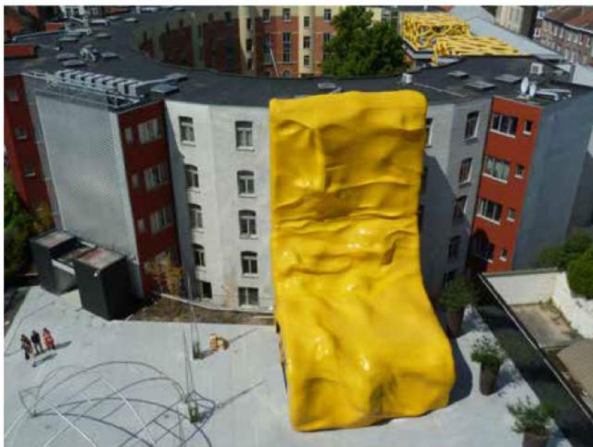
CIRBUATS, 2011-2013, (Zebrastraat Gent, Foundation Liedts-Meessens)